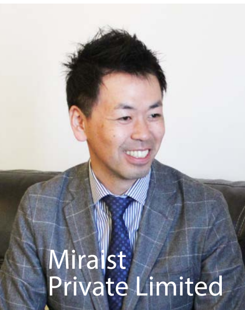
Miraist Private Limited