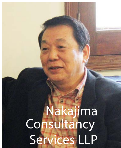
Nakajima Consultancy Services LLP

(関野) 中島さんはインド歴が大変長いと思いますが、インド人採用でうまくいったことやご苦労など、お聞かせ願えますでしょうか？